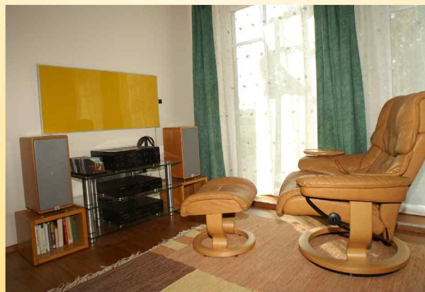
Infrartheizung als Wärmequelle im Wohnzimmer

Über 35% der deutschen Bevölkerung sind inzwischen Allergiker oder Asthmatiker. Feuchte Dämmungen überdachte Gebäudeisolation, Schimmelecken und verkeimte Lüftungsanlagen beeinflussen Gesundheit und Wohlbefinden. Bei Stress, Verspannungen, Muskelschmerzen, Rheuma; Rückenschmerzen, Unwohlsein, Migräne, Erkältung usw. kann die Infrarotwärme Ihr Wohlbefinden spürbar verbessern.