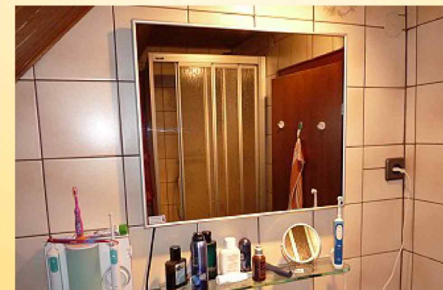
Spiegel-Infrartheizung ideal im Bad!!

Keine andere Wärmequelle ist so gesund wie eine Infrarot-Wärmewellenheizung, die keine Chemikalien, Staubpartikel, Gerüche oder sonstige Partikel an die Umgebungsluft abgibt. Bereits nach wenigen Minuten wird eine angenehme Wärme abgegeben, die vergleichbar ist mit der eines Kachelofens, jedoch ohne Sauerstoff zu verbrauchen. Die Wärmeverteilung ist im ganzen Raum gleichmäßig!