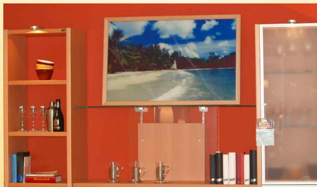
Infrartheizung als Bildheizung

- Infrarottechnologie aus der Weltraumforschung -